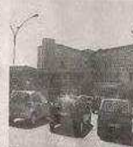
L'ospedale di Crema